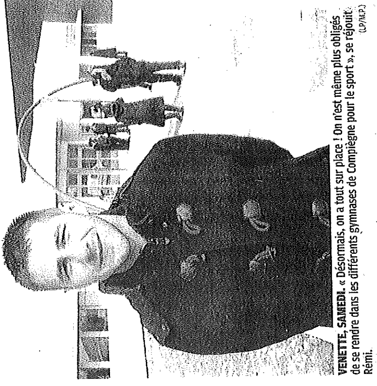
VENETTE. SAMEDI. « Désormais, on a tout sur place ! On n'est même plus obligés de se rendre dans les différents gymnases de Compiègne pour le sport », se réjouit Rémi. (L.P./M.P.)

MÉHDI PFEIFFER Proméo Formation : 03.44.20.70.10.